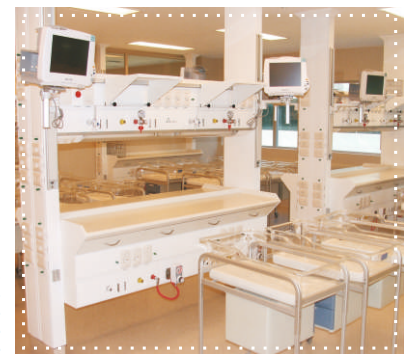
Sanatorio de la Trinidad (Bs. As.)

Su construcción está basada en la utilización de perfiles de aluminio extrudado, aptos para contener las prestaciones requeridas para abastecer un servicio médico Hospitalario, combinado con una mesada de apoyo que permite trabajar directamente sobre el recién nacido, y un conjunto de accesorios para organización del tipo de montaje múltiple "Polymount".